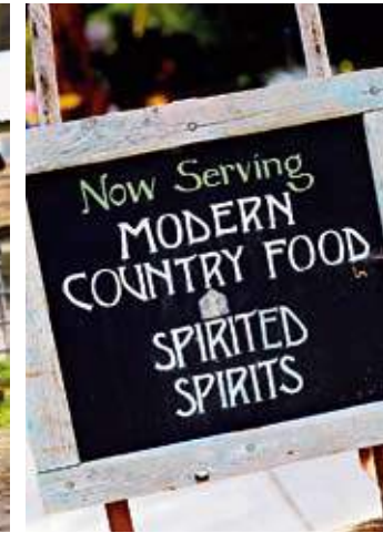
NÄRODLAT. På Farm to table-ställen kommer råvarorna från trakten.