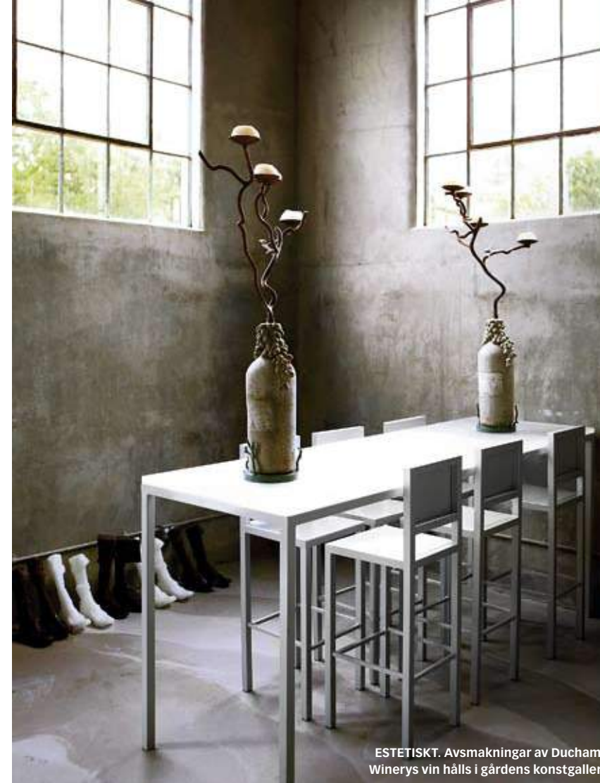
ESTETISKT. Avsmakningar av Duchamp Winerys vin hålls i gårdens konstgalleri.

Doug lagar det som inspirerar honom för stunden. Han komponerar avsmakningsmenyn som en symfoni genom att långsamt bygga upp smakerna till ett dramatiskt crescendo. Oavsett vad du beställer på Cyrus, skickas det alltid ut ett par extra rätter från köket och det blir garanterat en upplevelse. →