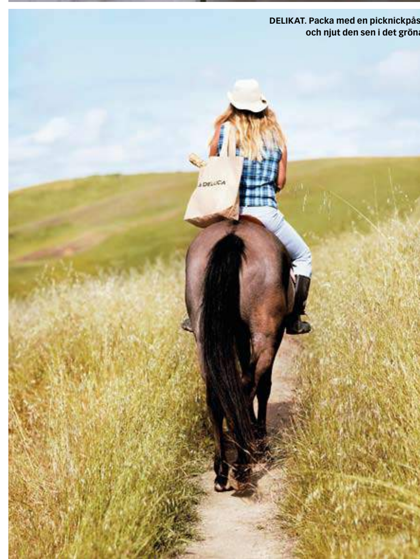
DELIKAT. Packa med en picknickpåse och njut den sen i det gröna.