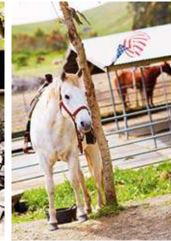
GRATIS. Sitt av och parkera hästen och njut av vackra platser i Sonoma.