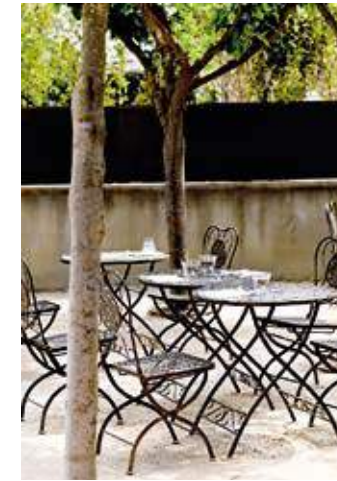
CHARMIG STAD. I Healdsburg finns många kaféer och restauranger.