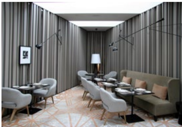
SKANDINAVISKT Das Stue andas lyxigt svenskt 70-tal med strukturtapeter och stram design.