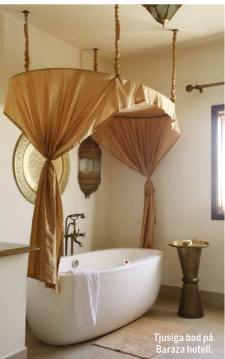
Tjusiga bad på Baraza hotell.

”Att kliva in på resorten är som att komma in på sultanens privata innergård.”