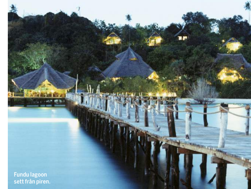
Fundu lagoon sett från piren.

"Varje detalj får besökaren att känna sig som en prinsessa."