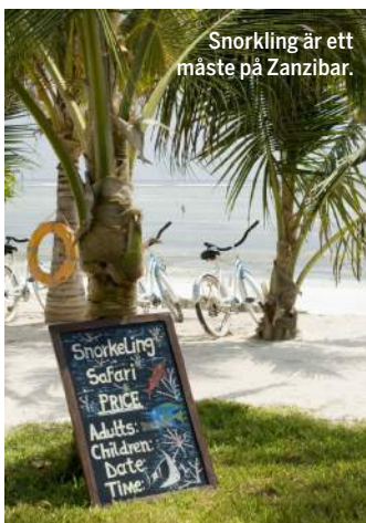
Snorkling är ett måste på Zanzibar.