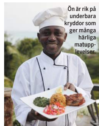
Ön är rik på underbara kryddor som ger många härliga matupplevelser.

Tälten är av typen lyxig safari med egen veranda mot havet. De varierar i storlek men var och en har ett sovrum (himmelssäng med myggnät), badrum med