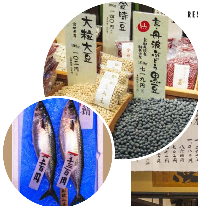
På marknadsgatan Nikishi dori kan du köpa allt från färsk fisk till ångande nudelrätter. Till höger: Kyotos äldsta tehus Ippodo.

”Kyoto har en alldeles egen rytm med sitt myllrande folkliv, som ändå känns lättsamt och avslappnat.”