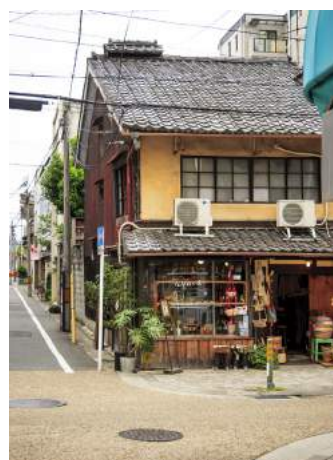
Den ena butiken är inte den andra lik i Kyoto.

Men Kyoto handlar inte bara om det förflutna. Trots sitt välbevarade arv omfamnar staden även framtiden. Området runt stationen är fullt av moderna byggnader, här finns flera universitet och en blomstrande IT-bransch. Det var bland annat i Kyoto som spelsuccén Nintendo skapades. Kyoto är också hem för Japans internationella mangamuseum. Och geishorna vi möter på gatan har givetvis en mobiltelefon i handen. Det är bara att konstatera att Kyotos största charm är det faktum att staden lever både i historien och i nutiden med samma lätthet. ★