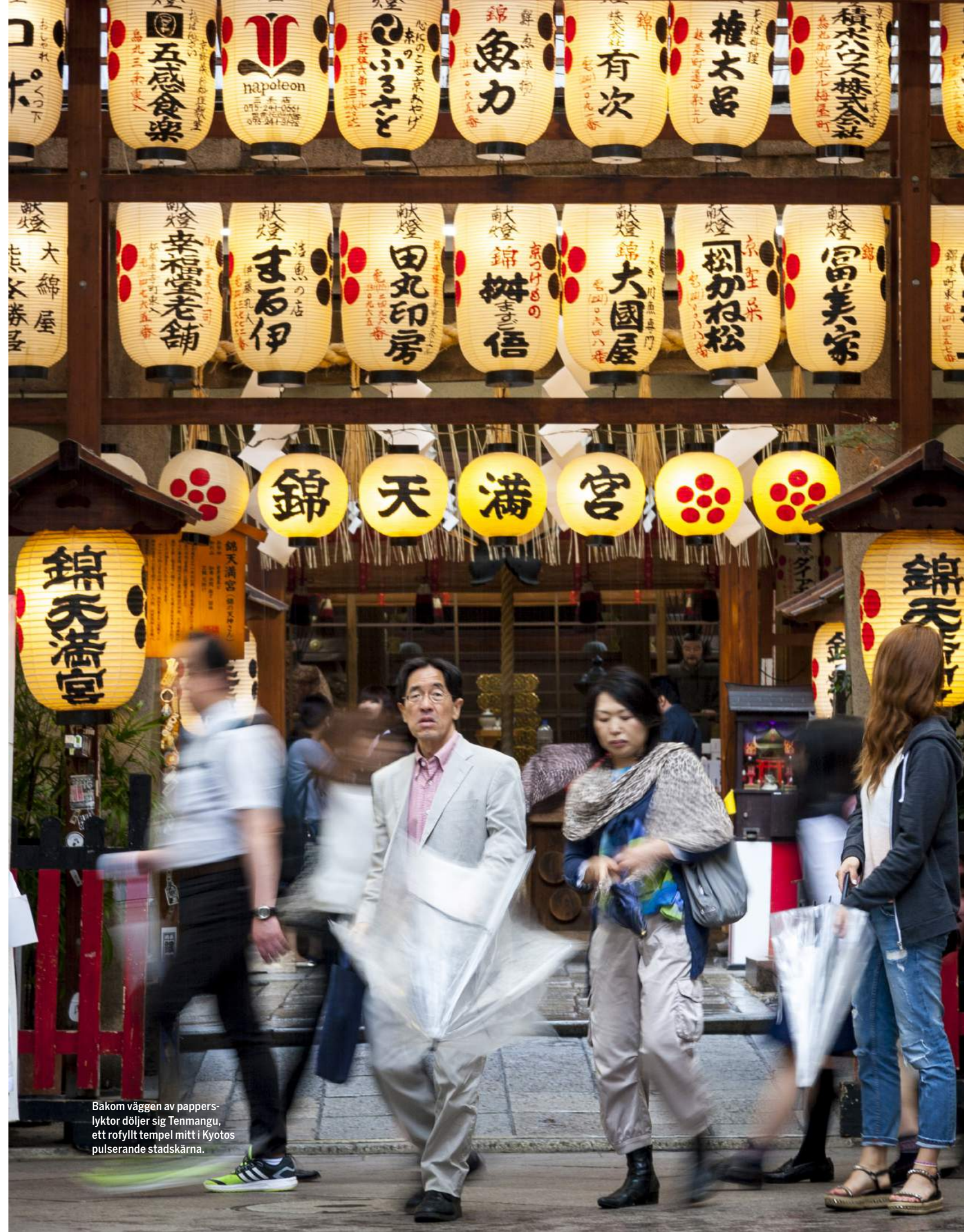
Bakom väggen av papperslyktor döljer sig Tenmangu, ett rofyllt tempel mitt i Kyotos pulserande stadskärna.

På Museum of Kyoto finns utställningar med modern konst i bottenvåningen. I huvudbyggnadens permanenta utställning visas hur det såg ut i Kyoto förr i tiden. Vill man i stället se det med egna ögon kan man ta sig till de gamla kvarteren runt Teramachi dori. →