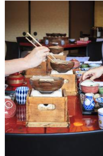
Frukosten på ryokan Tazuru består av många små rätter.