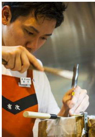
På Aritsugu kan du få världens bästa kockkniv med ditt namn ingraverat.