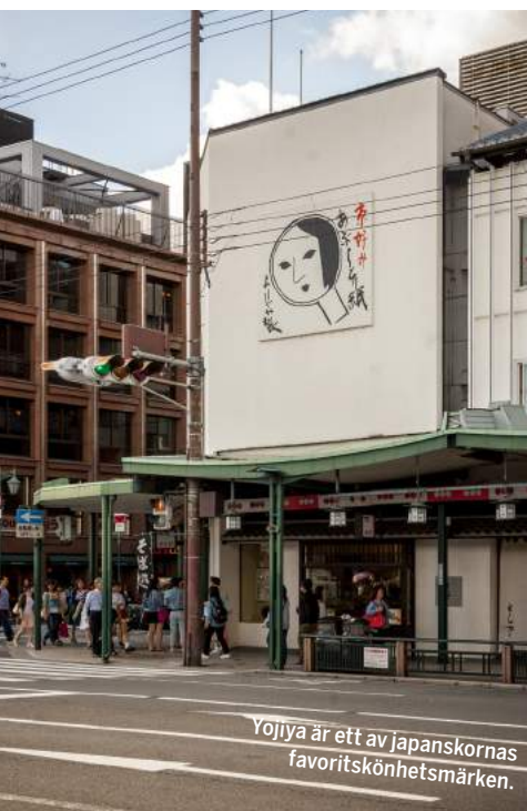
Yojiya är ett av japanskornas favoritskönhetsmärken.

Världens främsta knivar sägs komma från Kyoto, kockar från hela världen vallfärdar hit för att köpa arbetsutrustning. Aritsugu på Nishiki-marknaden är en av de bästa, här ingår en gravyr på knivbladet. Från 1100 kronor för en mindre grönsakskniv.