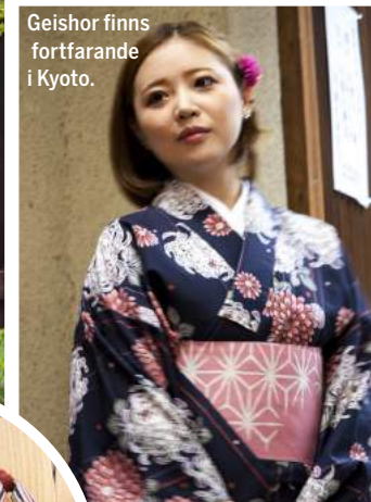
Geishor finns fortfarande i Kyoto.

Vid varje japanskt tempel finns rent vatten och en skopa för att skölja händer och mun.