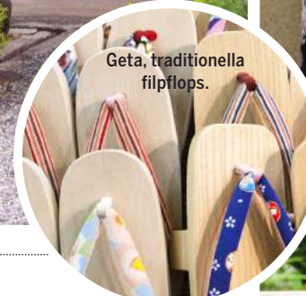
Geta, traditionella filpflops.

”Trots sitt välbevarade arv omfamnar staden även framtiden.”