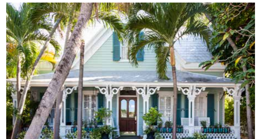
Bildtext Rum acestibus eaquis voloribus estecti beatibus quas molore none millitas