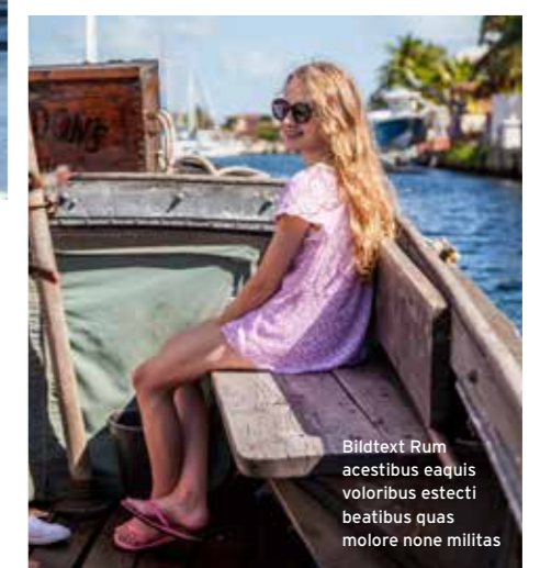
Bildtext Rum acestibus eaquis voloribus estecti beatibus quas molore none millitas