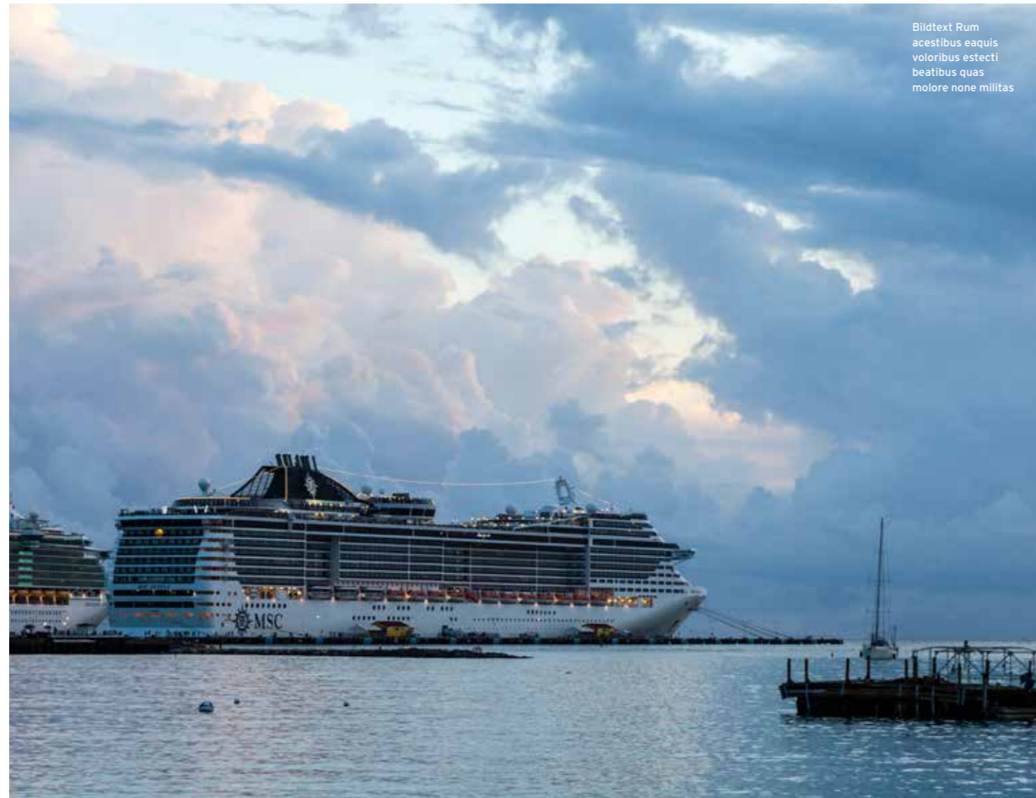
Bildtext Rum aestibus eaquis voloribus estecti beatibus quas molore none militas