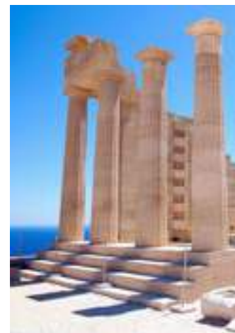
Rhodos egna Akropolis minner om en svunnen tid.

Den grekiska ön kan stoltsera med 300 av 365 möjliga soldagar, därav smeknamnet "Solens ö". I Rhodos stad finns en mix av historiska byggnader från olika tidsepoker. Ön var under 1300-talet en tillflyktsort för Jerusalems korsriddarorder, turkarna erövrade Rhodos 1523, och italienarna tog över 1912. Först 1948 blev ön en del av Grekland. Men för många är Rhodos inte förknippat med historia utan partyglada tonåringar från Skandinavien. På senare tid har den bredare publiken börjat återvända till ön, som erbjuder ett rikt kulturutbud, gourmetrestauranger och nybyggda designhotell. Landskapet lockar med vita stränder och grön natur. Den aktiva kan utnyttja de många vandringslederna medan vindsurfaren hittar Greklands bästa surfing på öns