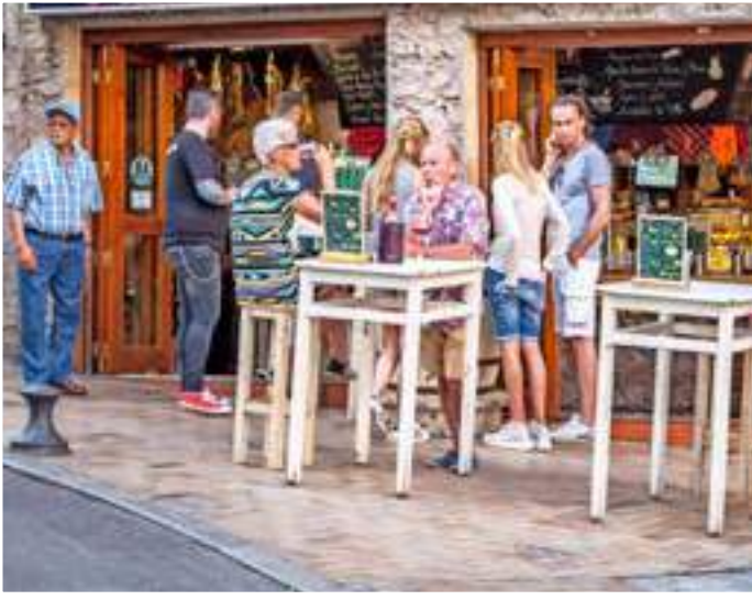
På "tapasgatan" Calle Santa Domingo serveras spanska smårätter på löpande band.

► En annan av Guadalests främsta sevärdheter ligger några hundra meter nedanför berget. Det är en naturlig vattenreservoar, vars azurblå vatten och många små vikar utgör ett exotiskt inslag i omgivningarna. Vi kan inte motstå att prova badtemperaturen, så vi tar jeepen nedför de smala, slingriga vägarna till reservoaren. Strandkanten är lite gyttjig, men vattnet är klart och svalkar efter en varm eftermiddag i bilen. Uppfriskade efter doppet kör vi vidare och når kusten först när mörkret lagt sig.