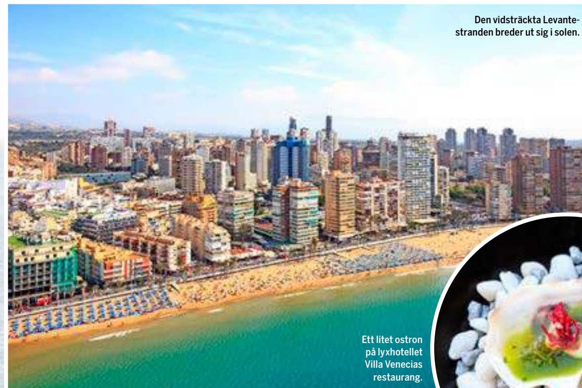
Ett litet ostron på lyxhotellet Villa Venecias restaurang.

Balcón del Mediterráneo är en av Benidorms mest kända platser.