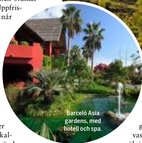
Barceló Asia gardens, med hotell och spa.

sparat på någonting. Byggnaderna, som ligger inbäddade i exotisk grönska mitt i Costa Bravas slättlandskap, utgör en mäktig syn. Det känns onekligen som om vi befinner oss på en annan kontinent när vi stiger in i lobbyn. Här har man ägnat detaljerna stor uppmärksamhet – varje nisch, hall och rum pryds av autentiska statyer och möbler. I den stora parken finns sju pooler och tio restauranger. Vill man ta sig ner till stranden i Benidorm cyklar man på en kvart.