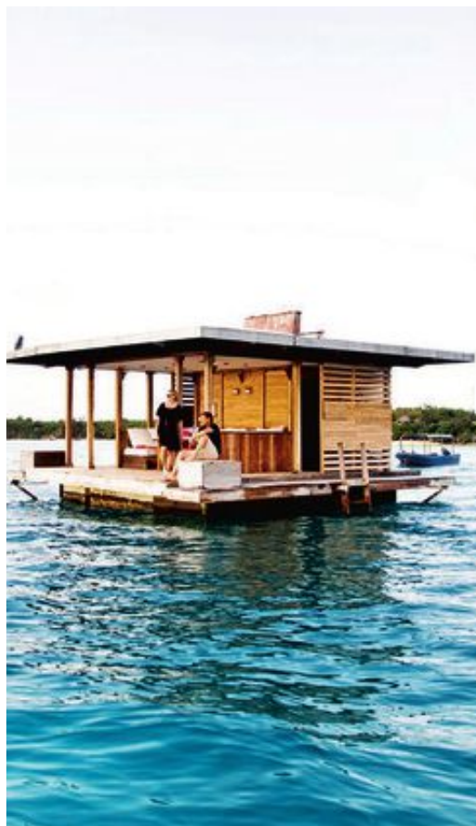
TVÅVÅNINGSHOTELL. Ett par hundra meter ut från stranden på Manta Resort flyter den här flotten.