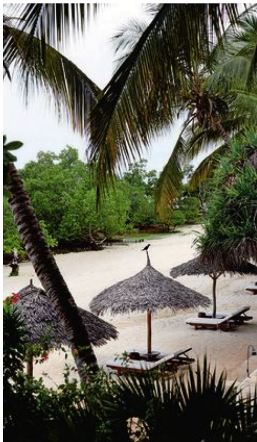
STILLSAMT. På Zanzibar är det lätt att hitta öar som bjuder på lugn och ro.