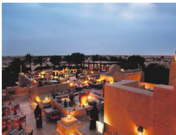
När mörkret sänker sig över öknen lyser lyktor upp i natten.