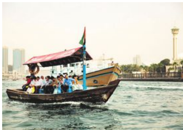
Att ta en abra, en båt-taxi, är det snabbaste och billigaste sättet att ta sig över till andra sidan floden som rinner genom Dubai.