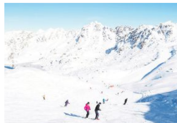
Gott om snö i Alperna.

■ Mest snö i Alperna fanns vid en mätning den femte december i italienska Cervinia, med ett snötäcke på 245 centimeter, enligt resebyråns STS Alpresor. På andra plats kom österrikiska Sölden med 213 centimeter, följt av St Anton, också i Österrike, med 163 centimeter. Håll koll på de aktuella snödjupen på skidorterna på sajterna onthesnow.com eller wepowder.com. (TT)