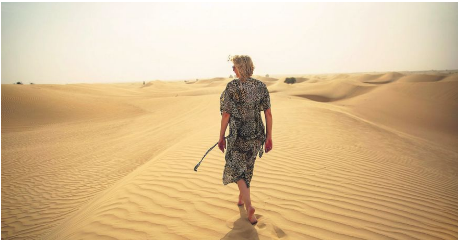
Ju mer desto bättre! Dubai omringas av sand. En tur i öknen är något man aldrig glömmer.