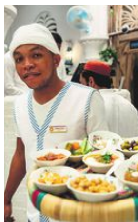
I Dubai finns små pärlor där man minst anar dem. På traditionella Arabian tea houses svala bakgård stannar man gärna till för en kopp starkt, sött te och lite arabiska delikatesser.