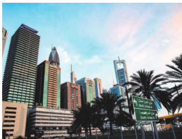
För den som vill lära sig mer om Dubais kultur finns Sheikh Mohammed Centre for Cultural Understanding, som syftar till att lära utländska invånare och turister mer om traditioner och kultur i emiratet.