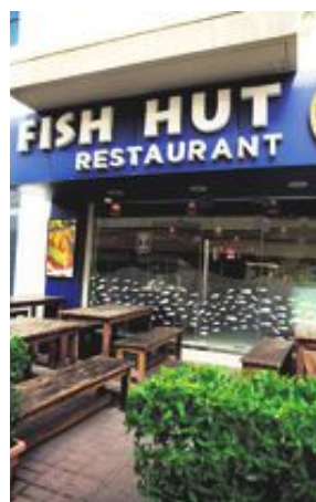
Som gammal hamnstad finns det givetvis också ett stort utbud av riktigt bra fiskrestauranger. Fish Hut är en sådan, med de finaste råvarorna som tillagas enligt konstens alla regler.