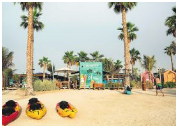
La Mer är ett av Dubais nyaste strandområden. Här finns två långa stränder, massvis med kaféer och restauranger och ett helt vattenland för de leksugna.