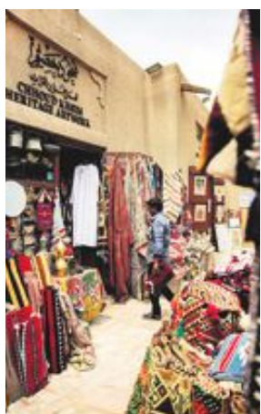
Kryddor, hantverk, antikviteter och andra traditionella varor säljs på basarerna i Al Fahidis gränder.