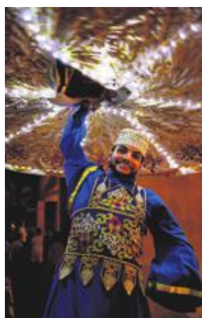
På ökenrestaurangen Al Hadheerah bjuds det bland annat på imponerande tanouradans, som går ut på att snurra en broderad filt med inbyggd belysning över huvudet en miljon gånger.