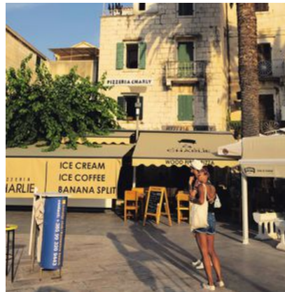
I fiskebyn Komiza på Vis finns charmiga soldränkta torg som inbjuder till att sitta ner och ta en kaffe.