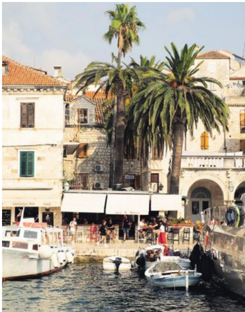
Den kroatiska skärgården är högst levande, med städer och byar där vardagslivet pågår parallellt med turismen.

Och ja, han har läst mig väl. Jag lutar mig inåt mot bilens mittpunkt när hjulparet slirar i gruset ovanför ett högt stup på småvägarna över till öns motsatta sida. Snart når vi Komiza, en rofylld, timjansdoftande fiskeby med ljusa stenhus, medeltida kyrkor och trånga gränder – omgiven av orörd natur, gömda