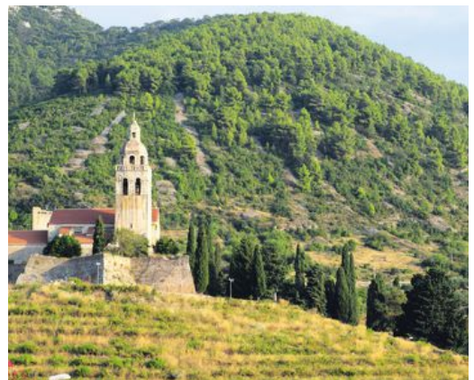
Ute på öarna odlas Kroatiens bästa viner.