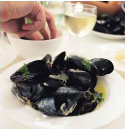
Öarnas marknader har ett härligt utbud av färsk fisk, skaldjur och grönsaker.