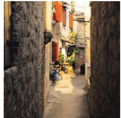
Trogirs smala gränder är en kvarleva från när grekerna grundade staden för över 2 300 år sedan.