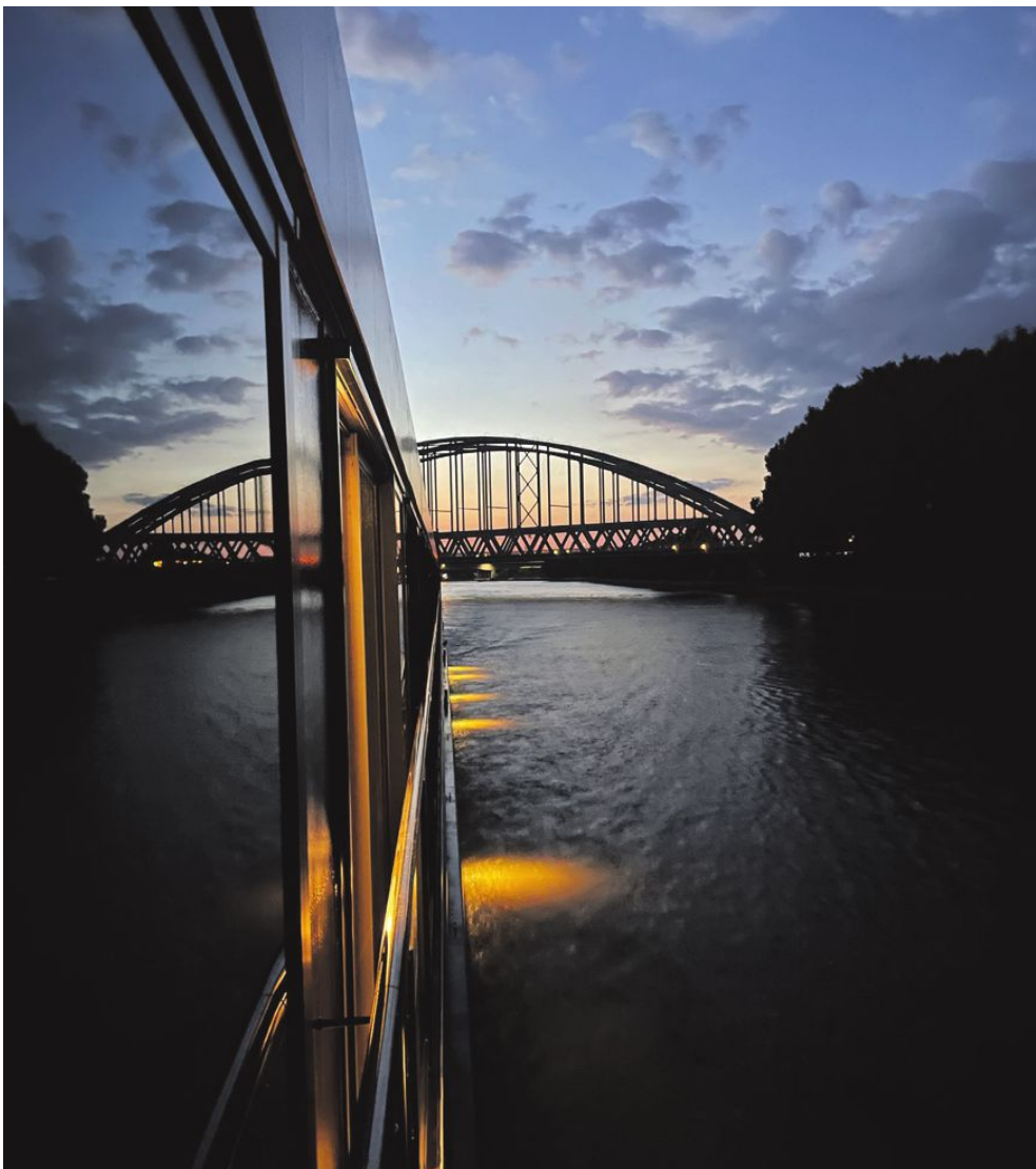
Under natten färdas Viva One längs floden och lägger till i en ny hamn redan innan gästerna har stigit upp.

Södermanlands Nyheter Lördag 22 oktober 2022