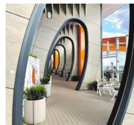
På Celebrity Beyond har man satsat stort på modern design och arkitektur.