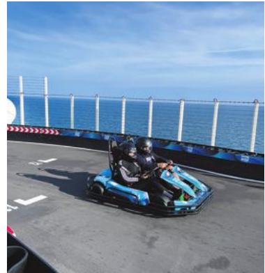
Norwegian Prima lockar med många aktiviteter för hela familjen, som till exempel en go-kartbana i tre plan.