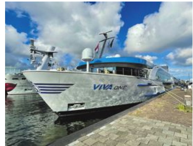
Flodkryssningsfartyg som går på Rhen är låga och långsmala och kan därmed lägga till nära städernas centrum.