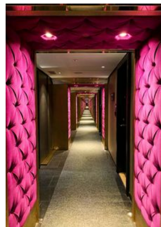
Färgstarka tyger och samtidigt ett avskalat intryck är melodin på Vox i Jönköping.