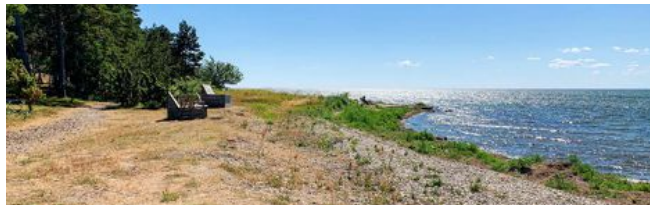
Ett par stenkast från Eco By Strandnära ligger stranden och sundet som skiljer Öland från fastlandet.