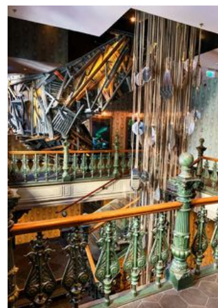
Trappan på Stora Hotellet i Umeå är klädd med upphittade föremål från renoveringen.