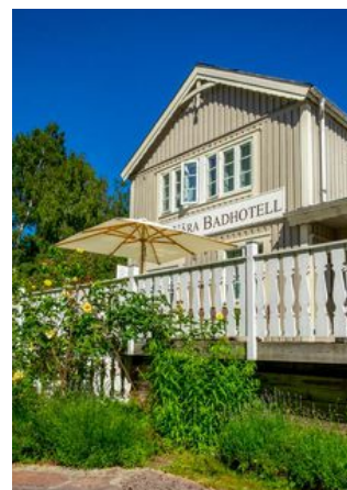
Eco by Strandnära är ett gammalt badpensionat med anor från 1928.