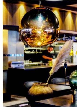
Färagskalan på Vox går i guld och ger lite av en nattklubbskänsla.