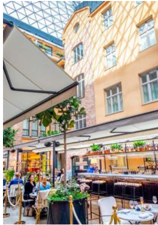
Framåt eftermiddagen fylls inntorget på Villa Dagmar med folk och sorl.

Innergården är hotellets hjärta och för tankarna till en italiensk piazza. Här finns en mat- och vinbar med barhång och bekväma soffor, liksom ett kafé för frukostmöten och eftermiddagsfika. En kombinerad concept- och blomsterbutik ger innergården ytterligare liv och rörelse.