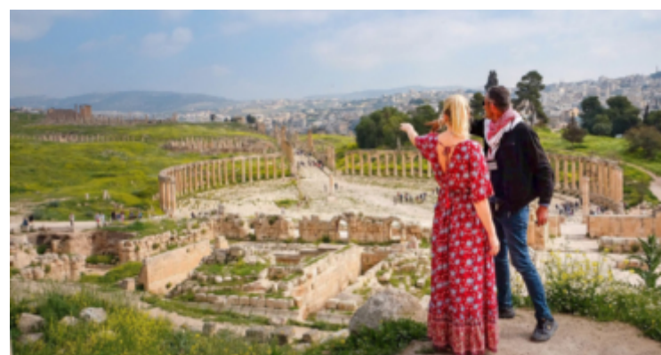
Historien gör sig ständigt påmind.

Visst är det kommersiellt, dalgången som öppnar sig är fylld av kamel- och åsneförelare som erbjuder fotografering och transport, souvenirförelare och självpåtagna guider. Men att låta en lokal förmåga berätta om sevärdheten kan om inte annat ge en god inblick i livet i dagens Jordanien. Hårda fakta kan man läsa i en guidebok.