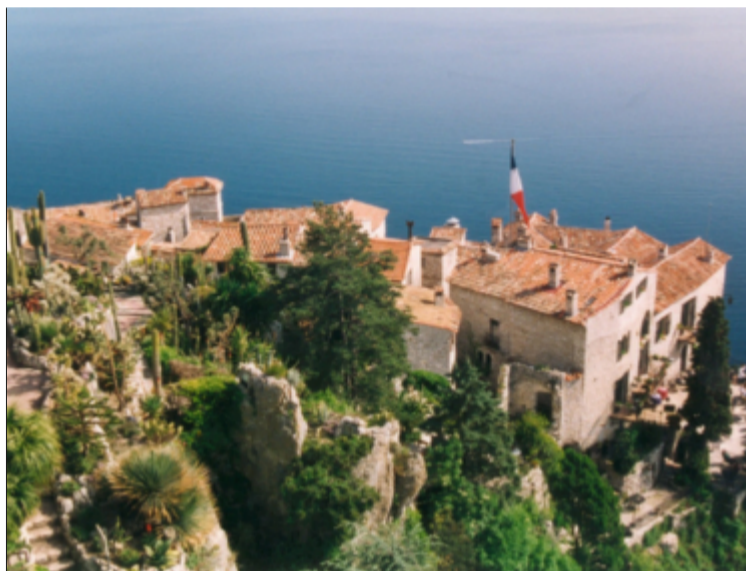
Kaktusdröm med milsviid havsutsikt.