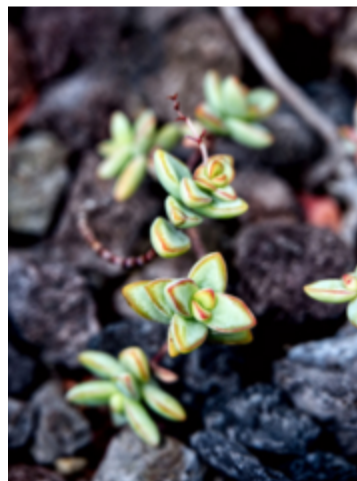
Hortus Botanicus uppfördes på 1500-talet.