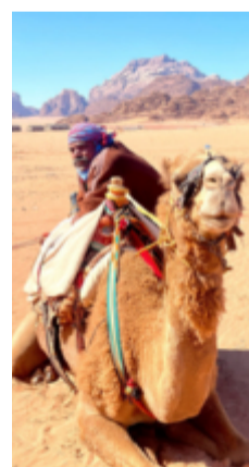
Fotogeniska kameler finns alltid på plats.