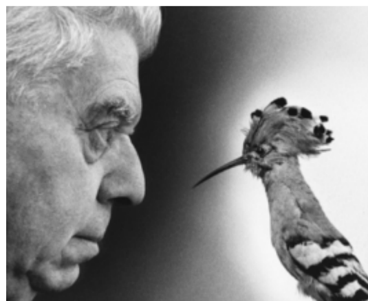
Ugo Mulas inviger Venedigs fotomuseum.