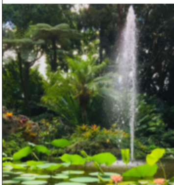
Prunkande grönska i en ravin.