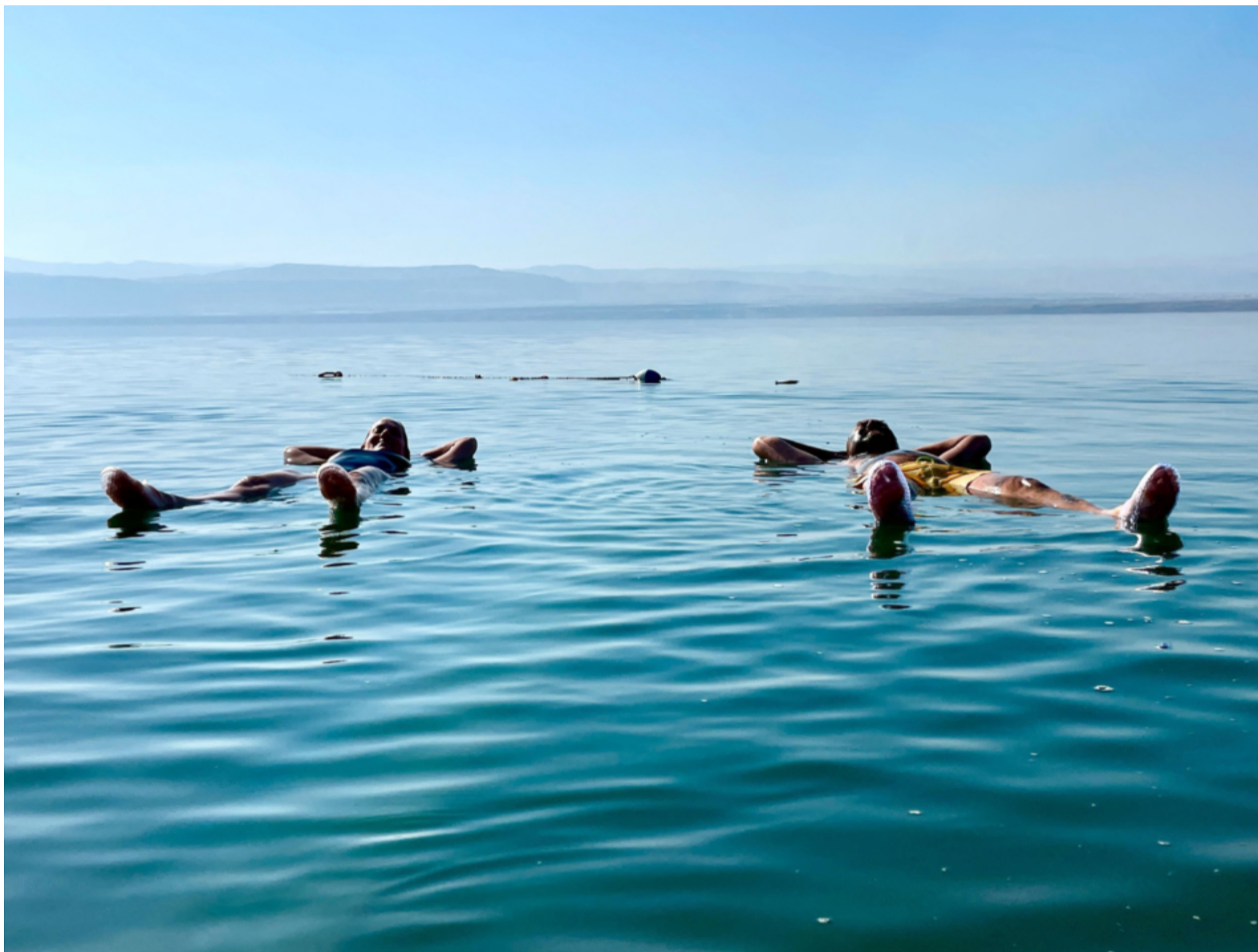
Skönt flyt i Döda havet.