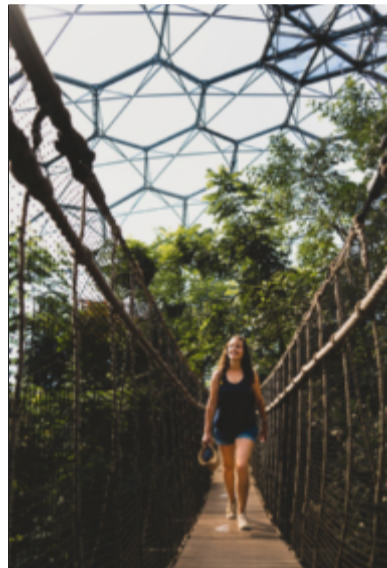
En modern engelsk trädgårdsupplevelse.