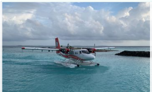
Sjöflygplan är det snabbaste sättet att ta sig till och mellan de olika lagunerna. De flyger dock bara under dagtid.