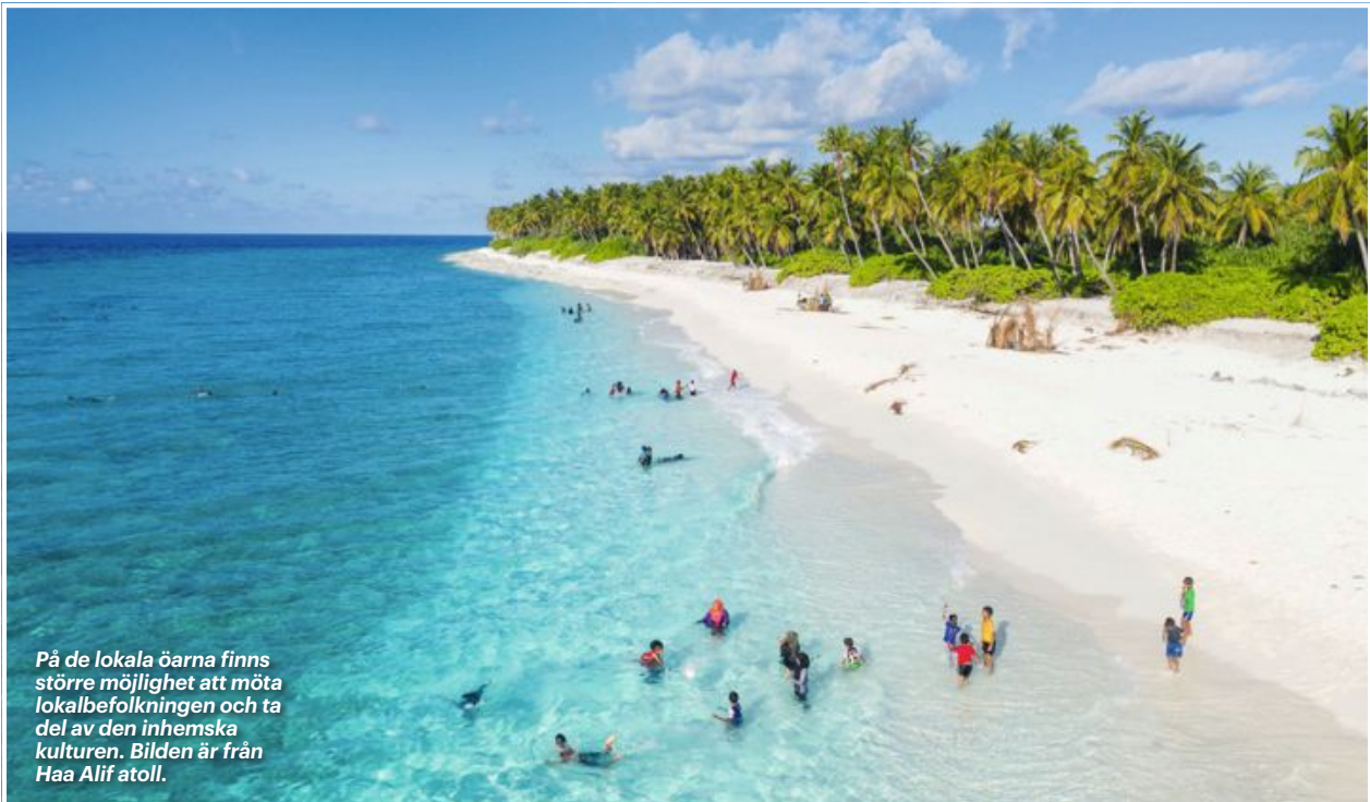
På de lokala öarna finns större möjlighet att möta lokalbefolkningen och ta del av den inhemska kulturen. Bilden är från Haa Alif atoll.

E n dag smyger vi upp i ottan för en fiskeutflykt tillsammans med några andra morgonpigga gäster. Vi förses med metspön och agn, sedan är det bara att rulla ut linan och vänta. Det dröjer inte länge innan den första fisken nappar. Som på kommando dyker också en flock delfiner upp och gör akrobatiska hopp.