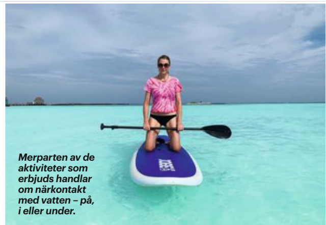
Merparten av de aktiviteter som erbjuds handlar om närkontakt med vatten – på, i eller under.

Ön Maafushi som ligger 40 minuter med båt från Malés flygplats har en mängd privata