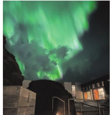
Sannolikheten att man får se norrsken är hög, särskilt under perioden oktober till mars.