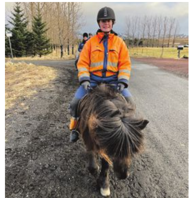
En tur på islandshäst är nästan obligatorisk när du besöker ön.