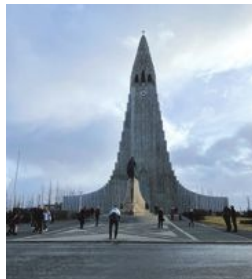
Hallgrímskirkja tog 41 år att bygga, då den finansierades med lokala insamlingar. Den stod klar 1986.

Vädret spelar en central roll på Island, och det är bara att anpassa sig. Det får vi erfara redan nästa dag när vinden är så kraftig att affischerna blåser av reklamtavlor. Vi söker skydd i de naturligt varma poolerna vid havs-