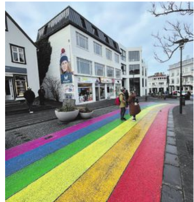
Reykjavik är en av Europas minsta huvudstäder, men har ett levande kultur- och nöjesliv.