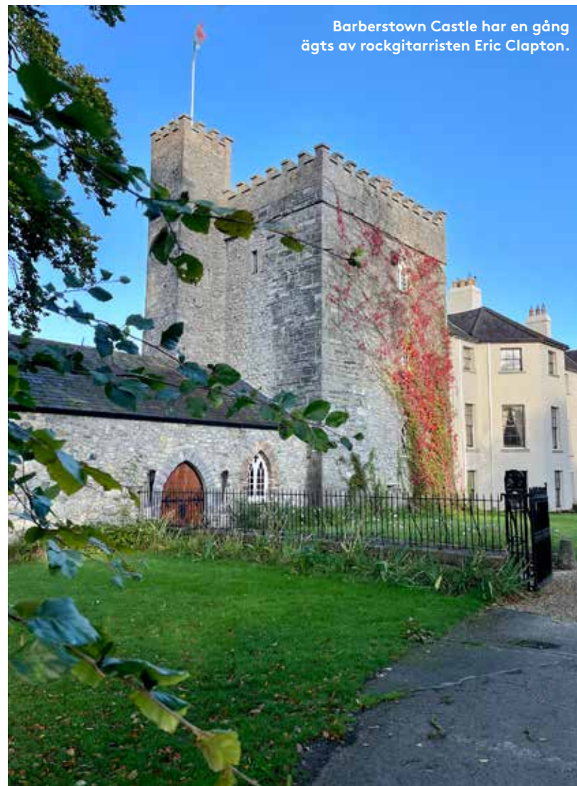
Barberstown Castle har en gång ägts av rockgitarristen Eric Clapton.

– Hon behövde nog bara lite holländskt mod, säger bartendern och refererar till det nederländska bruket av genever för att klara av trettioåriga kriget, utan att göra någon som helst jämförelse med äktenskap. >