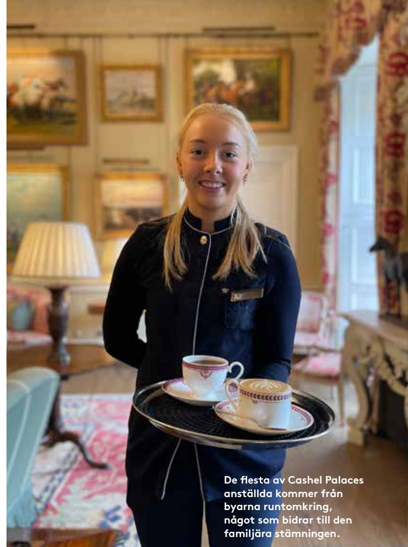
De flesta av Cashel Palaces anställda kommer från byarna runtomkring, något som bidrar till den familjära stämningen.