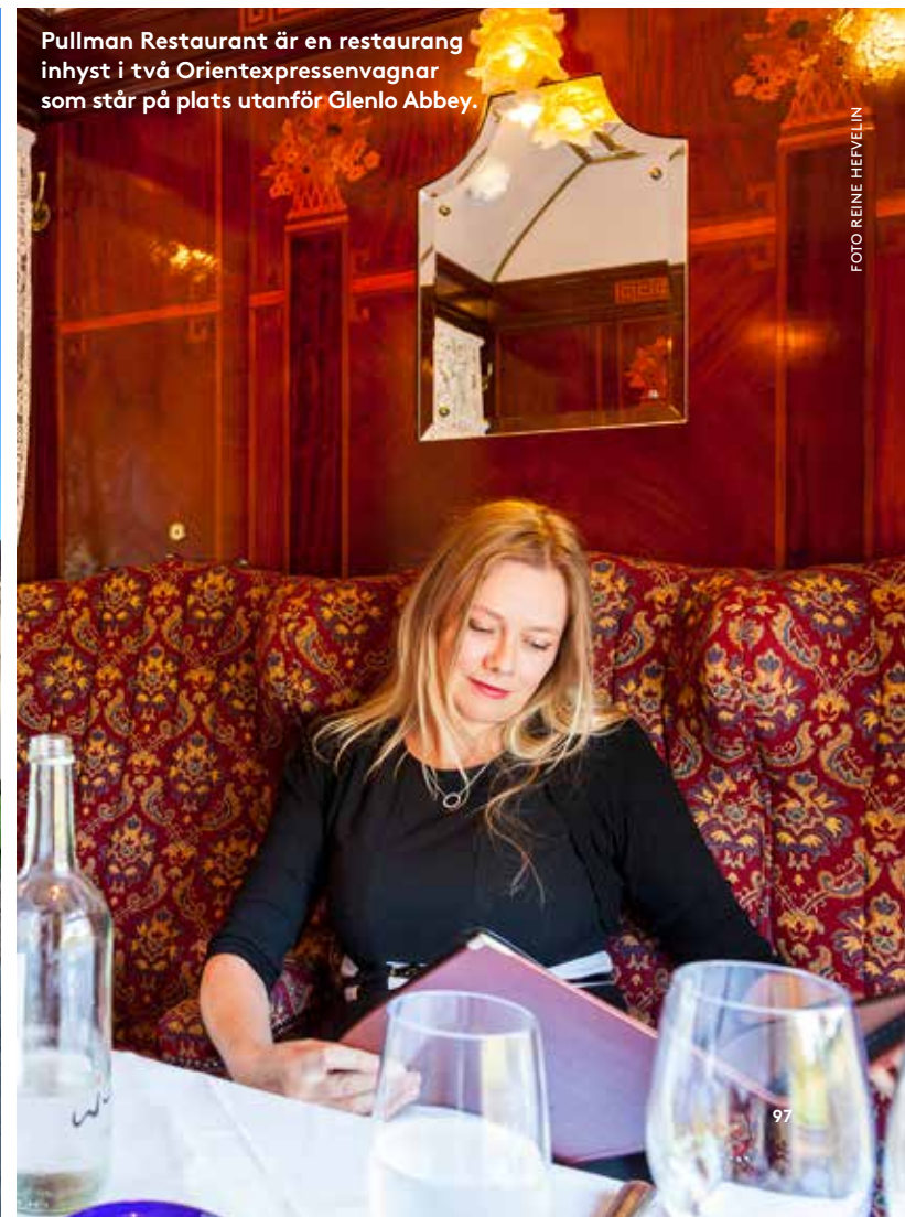
Pullman Restaurant är en restaurang inhyst i två Orientexpressvagnar som står på plats utanför Glenlo Abbey.