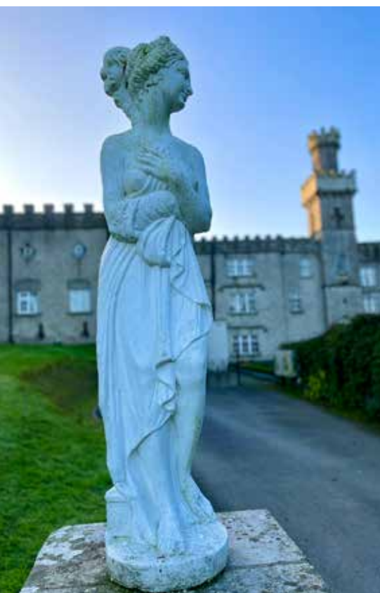
Cabra Castle har förstörts och byggts upp så många gånger att ingen vet riktigt från vilken tid de olika delarna kommer ifrån.

Att bo på ett slottshotell är kanske den mest perfekta inramningen på en romantisk resa för ett par. Och i så fall är Irland antagligen den perfekta destinationen, för här nästan snubblar man över dem vart man än vänder sig. Det sägs att det ska finnas över 30 000 slott på Irland, mycket tack vare att landet historiskt sett har varit relativt rikt. Många slott byggdes som befästningar för att försvara engelska eller irländska styrkor, medan andra uppfördes som statusfyllda hem åt adelsfamiljer. Och tack vare deras rejäla konstruktioner med metertjocka murar står många av dem kvar än i dag. Lyckligtvis har några under årens lopp omvandlats till lyxösa hotell, så i dag behöver man inte vara blåblodig för att njuta av dem.