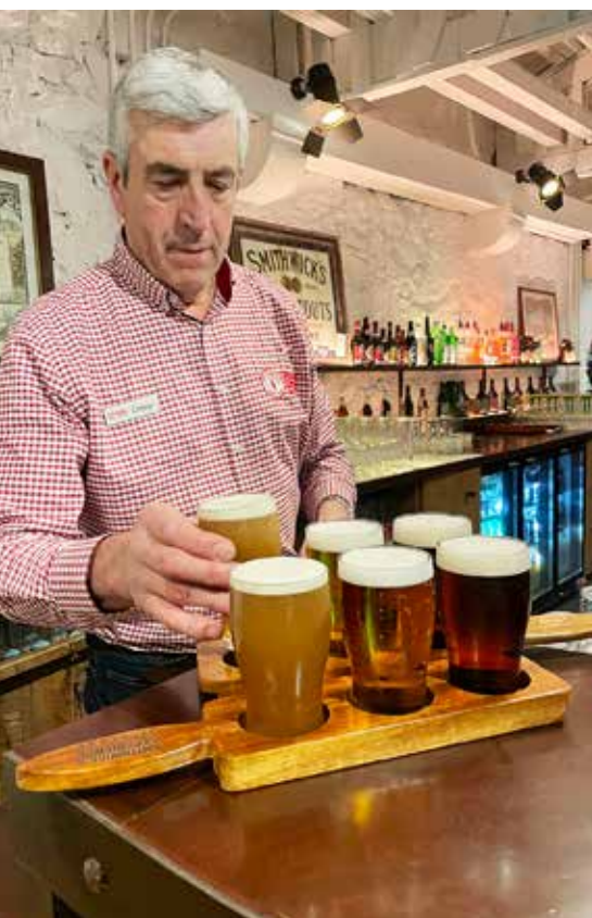
På Smithwick's bryggeri i Kilkenny får man lära sig allt om öltillverkning, och givetvis får man även smaka på slutresultatet.