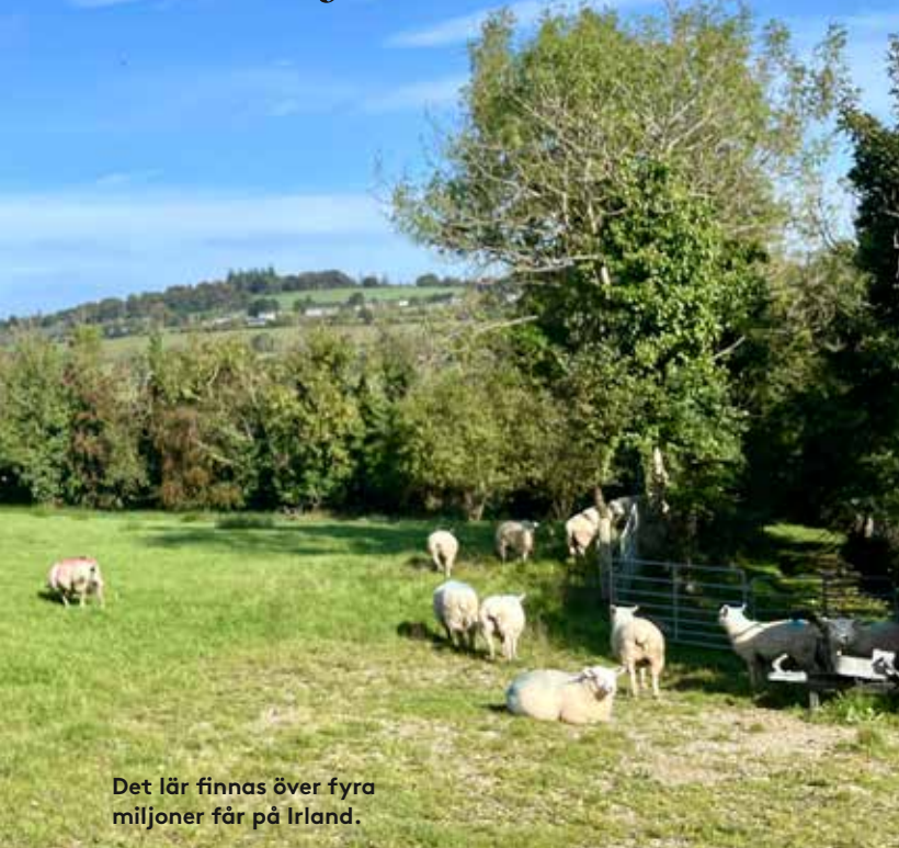
Det lär finnas över fyra miljoner får på Irland.

»Det är omöjligt att köra mer än fem minuter utan att se en fårscock«