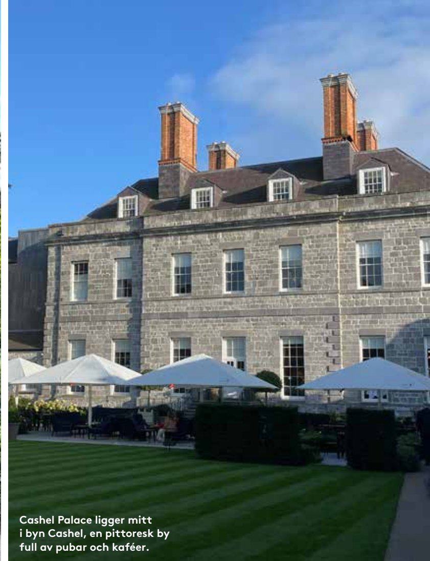
Cashel Palace ligger mitt i byn Cashel, en pittoresk by full av pubar och kaféer.