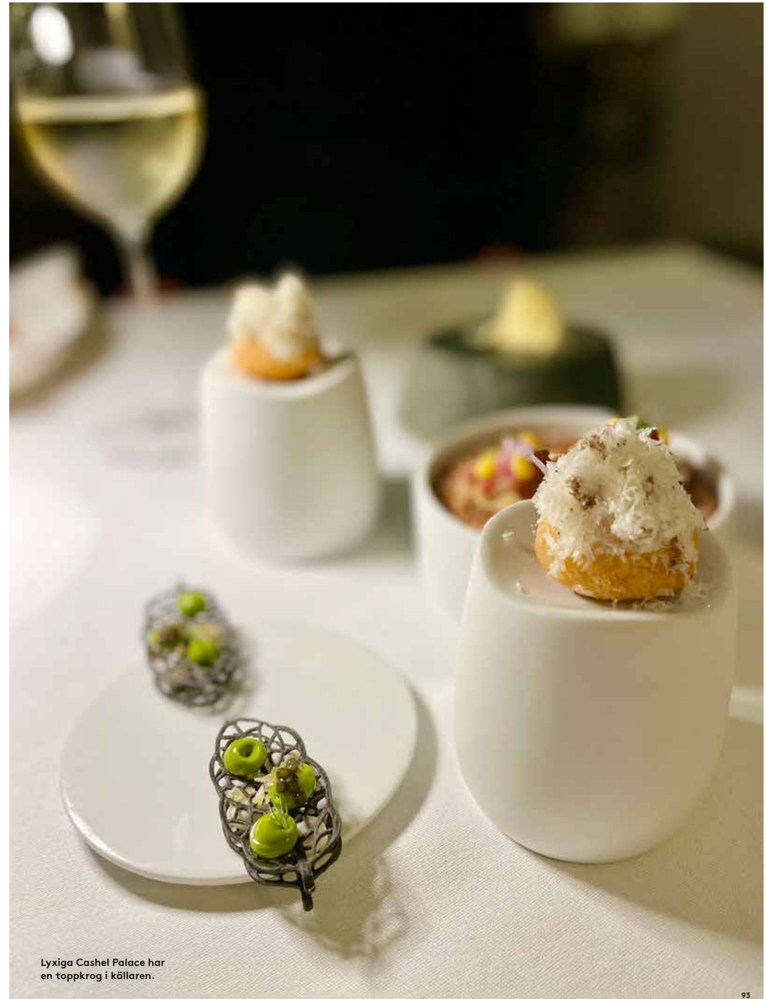
Lyxiga Cashel Palace har en toppkrog i källaren.