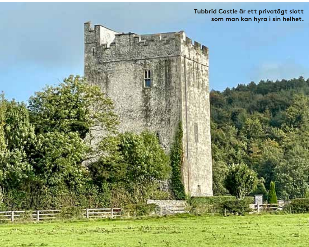
Tubbrid Castle är ett privatägt slott som man kan hyra i sin helhet.

Det sägs att gästfrihet en gång var lagstadgad i det forntida Irland. Resande kunde alltid räkna med att få en varm måltid, en ren bädd av halm och underhållning med musik och berättelser vid brasan på landsbygdens gårdar. Den irländska lagen om gästfrihet kanske inte gäller i dag, men den har onekligen satt sin prägel på det irländska folket – ett genuint trevligt folk som är måna om att visa upp den bästa bilden av vad Irland och dess många slott har att erbjuda. Och det vill inte säga lite. □