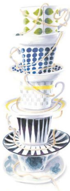
"KAFFEREP" AV SARA W NELIN