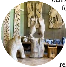
Eva Rynnänen träskulpturer föreställer ofta barn och naturväsen.

Nationalromantiken blomstrade i Finland under början av 1900-talet och tog stort intryck från naturen och de karelska sagorna. Eva Rynnänen (1915–2001) är en av Norra Karelen mest kända konstnärer. Hon levde sitt liv i skogarna runt Lieksa och byggde där också sitt hem Paateri och sin vackra ateljé, som båda är öppna för allmänheten. Eva Rynnänen utförde skulpturer och väggreliefer i trä och dekorerade sitt hem med träskulpturer föreställande barn, sagofigurer och naturväsen.