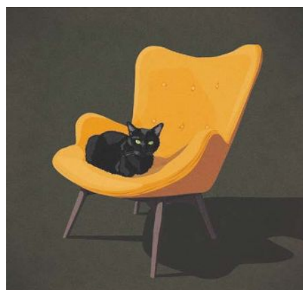
"THE YELLOW CHAIR" AV KRISTIN ERIKSSON