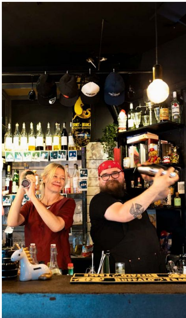
Hemgjorda tonics och tinkturer, örter i koncentrerad, flytande form, ligger till grund för goda drinkar på cocktailkursen hos Another Doggy.

Från toppen av berget tar vi en uråldrig stollift ner i dalen, och här gäller det att hänga med. Liften har ingen inbromsning, utan man får hoppa på och av i den ganska höga farten. Men det är