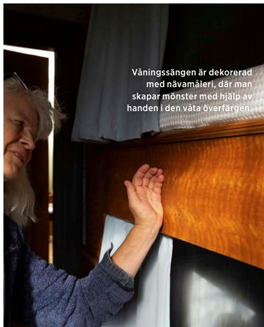
Våningssängen är dekorerad med nävamåleri, där man skapar mönster med hjälp av handen i den våta överfärgen.