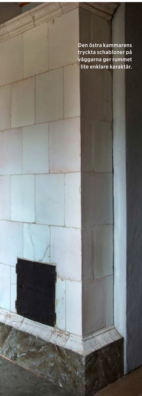
Den östra kammarens tryckta schabloner på väggarna ger rummet lite enklare karaktär.