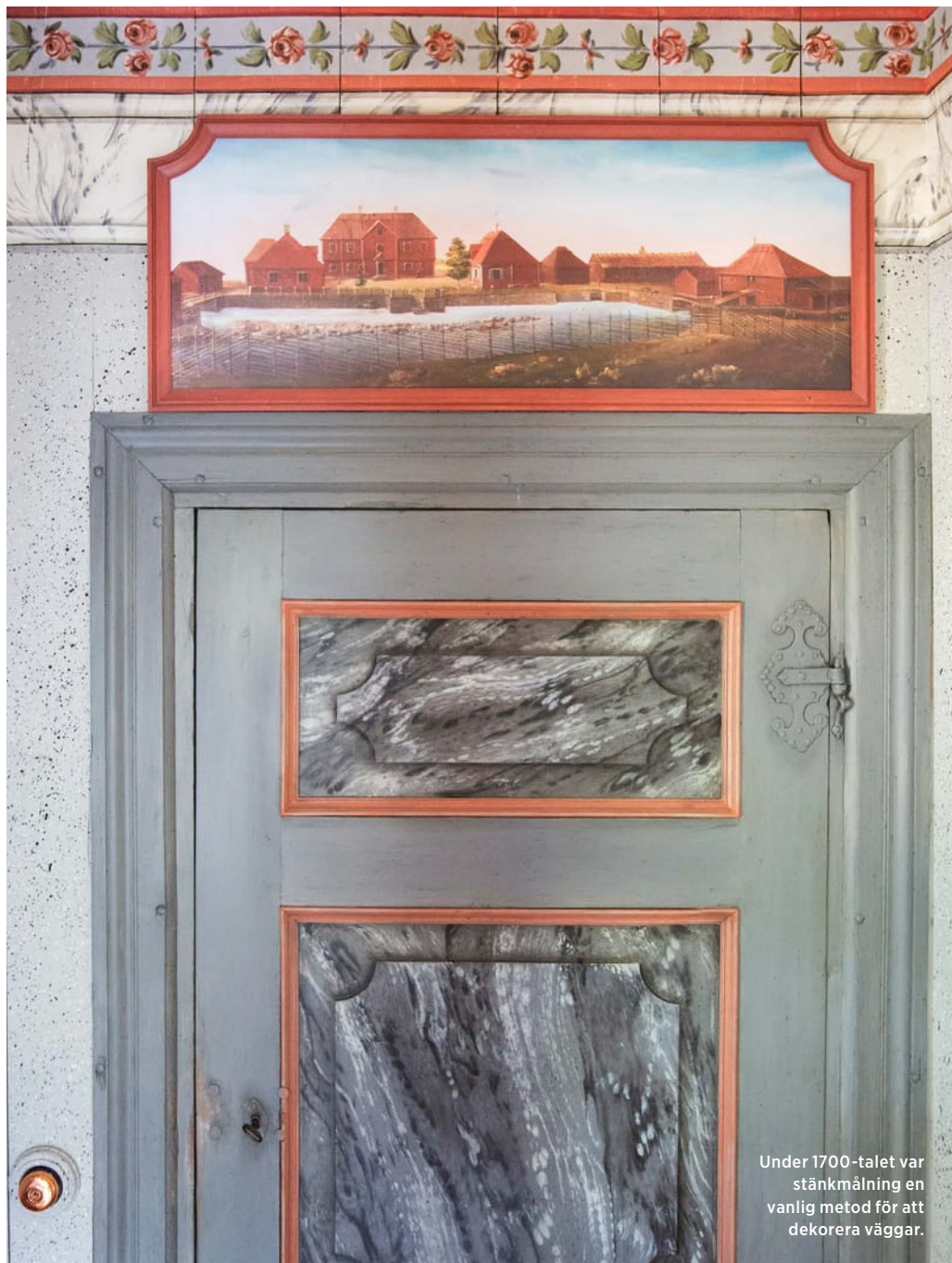
Under 1700-talet var stänkmålning en vanlig metod för att dekorera väggar.