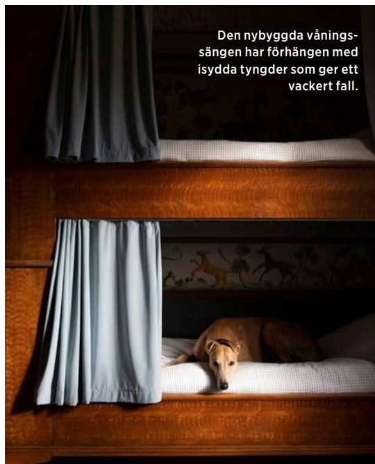
Den nybyggda våningssängen har förhängen med isydda tyngder som ger ett vackert fall.