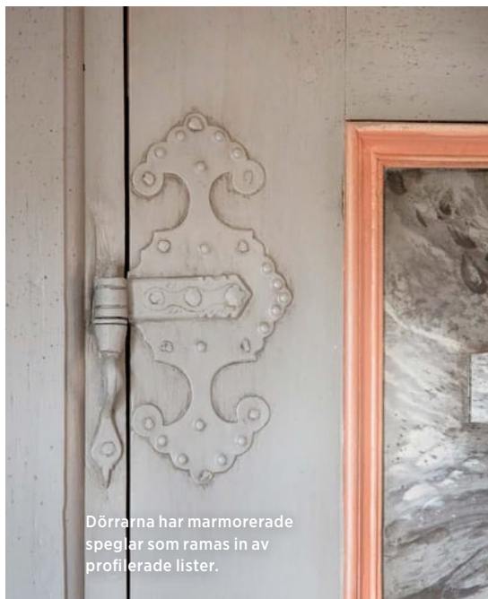
Dörrarna har marmorerade speglar som ramas in av profilerade lister.