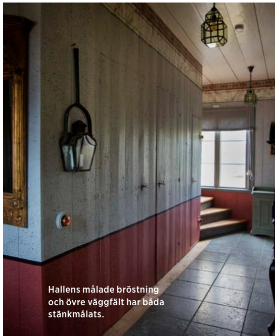
Hallens målade bröstning och övre väggfält har båda stänkmålats.