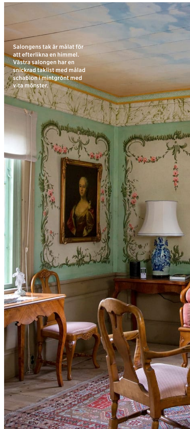
Salongens tak är målat för att efterlikna en himmel. Västra salongen har en snickrad taklist med målad schablon i mintgrönt med vita mönster.

D en stora branden som rasade i Västmanlands skogar sommaren 2014 gjorde till slut halt bara några kilometer från den vackra Bergslagsgården. Då hade gården stått där sedan 1697, och man kom undan med blotta förskräckelsen. Några år före branden härjade hade ett omfattande renoveringsarbete påbörjats på gården.