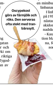
Oscypek kost görs av får mjölk och röks. Den serveras ofta stekt med tranbärssylt.

Nära bottenstationen ligger restaurang Leśniczówka bland träden. Namnet betyder skogsvaktarens stuga och det är ett mysigt, modernt lunchställe. Här serveras traditionell mat på ett fräscht sätt – perfekt efter en dags skidåkning.