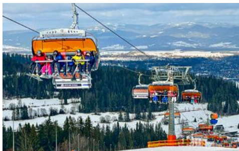
Bialka Tatrzańska består av tre skidområden som hänger ihop.

Från hotellet Aries nära Zakopanes centrum promenerar vi ner på stan senare samma kväll. Den trädkantade gatan Krupówki är flankerad av butiker, skiduthyrare, ljusslingor, souvenirförsäljare, ångande bagerifönster där glaserade munkar ligger staplade och marknadsstånd som säljer grillad ost och hett vin. Den skulle kunna ligga i vilken skidort i Alperna som helst, även om de mest exklusiva märkena lyser med sin frånvaro. ➔