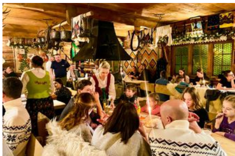
Kvällarna är ofta livliga på stadens restauranger med lokala band som spelar.