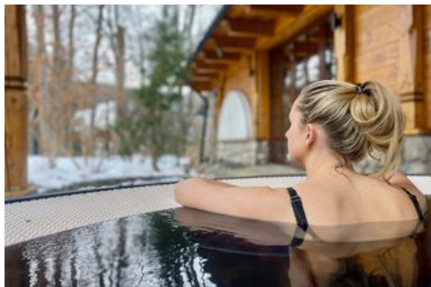
Aries Hotels varma utomhuspooler är en lisa för trötta skidmuskler.