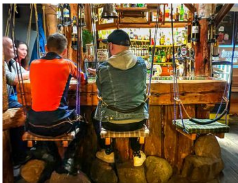
Zakopane har flera trevliga barer, som Cafe Piano med gungor som barstolar.