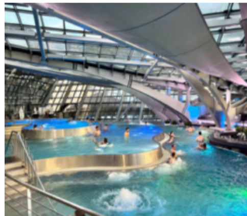
Extra stor spa-upplevelse. Foto: Alamy

Funicamp är Europas längsta kabinbana. Foto: Alamy