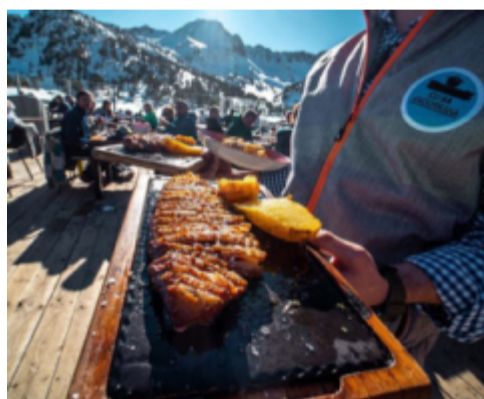
Lokala smaker på Refugi del Llac de Pessons.

Vår sista dag blir det ännu en klassisk tur genom Grandvalirasystemet. Först nöter vi de breda, solbelysta pisterna i Grau Roig med vy över dalgången och de omgivande bergen. Framåt lunch börjar vi röra oss tillbaka och tar de blåa backarna ner mot Refugi del Llac de Pessons, en av Andorras mest ikoniska bordas. Dessa små stenhus, ursprungligen byggda som lador och sommarbostäder i bergen, har i flera fall fått nytt liv som stämningsfulla restauranger.