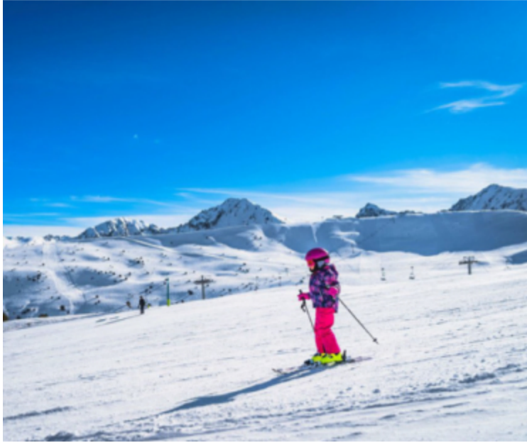
Gott om nedfarter för alla åldrar. Foto: Alamy

Andorra är en av Europas mest snösäkra destinationer. Här Pas de la Casa. Foto: Alamy