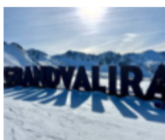
Grandvalirasystemet består av över 200 kilometer pist.

Men för att ändå försäkra sig om att man