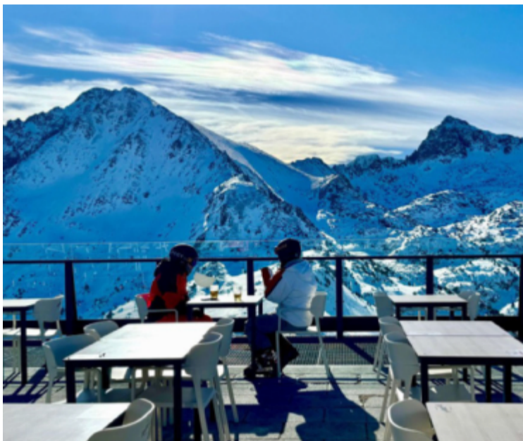
En stunds vila högst upp i Grandvalirasystemet.