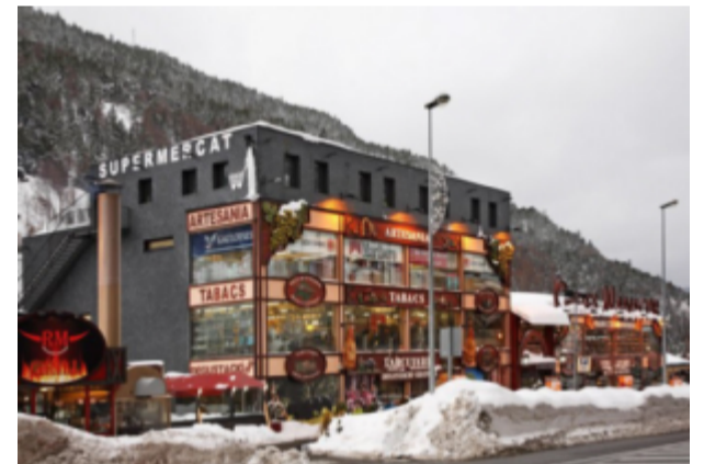
Gourmetshopping i El Tarter.

Det var först på 2000-talet som de kunde komma överens om att bygga ihop flera av dem till det som nu är ett av Europas största system.